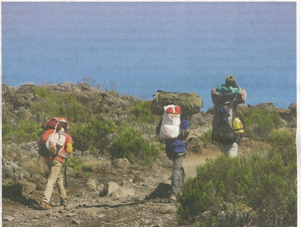
Till vänster: Alpin öken och colobusapor på Kilimanjaro. Ovan: Bärare i Tanzania.

Det kallas Afrikas Tak. Med sina 5895 meter över havet reser sig Mount Kilimanjaro som en mäktig klippa genom molntäcket över ett hett och fuktigt Tanzania. Det är Afrikas högsta berg, en enorm sloknad vulkan med en egen nationalpark och världens högsta fristående berg.